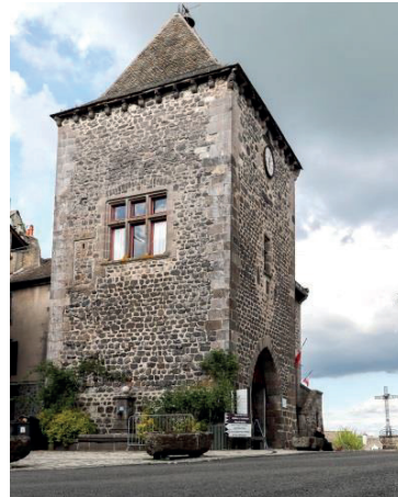
Mur-de-Barrez - Tour de Monaco