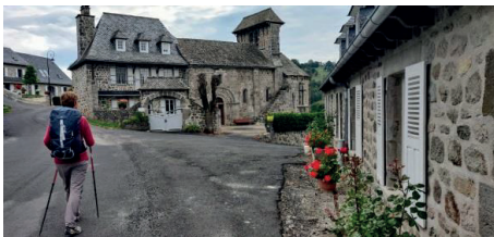
Eglise de Brommes

Informations / réservations au 05.65.66.10.16 / 06.11.30.53.95