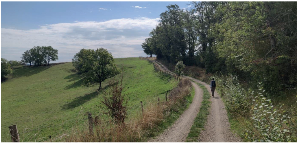
Chemin de Cluny