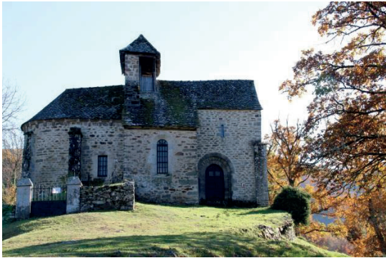
Chapelle de Manhaval